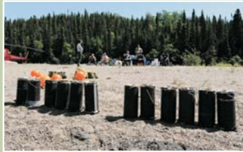
Trappes à sédiments après leur retrait