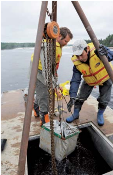
Retrait des cubes d'infiltration