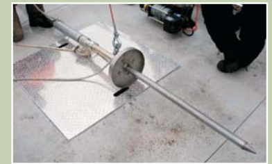
Tige du carottier glaçant