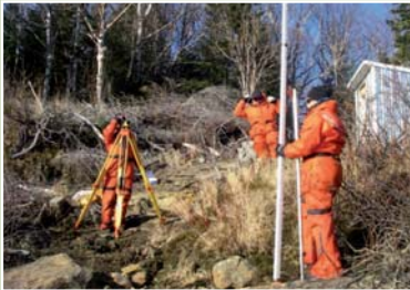
Mesure du niveau d'eau