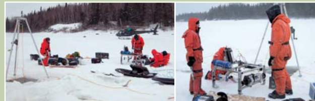
Installation de l'équipement de suivi automnal