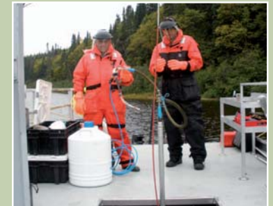
Carottage à l'azote liquide à partir d'un ponton