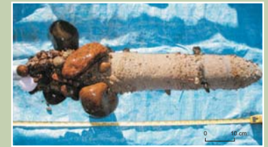
Carotte de sédiments