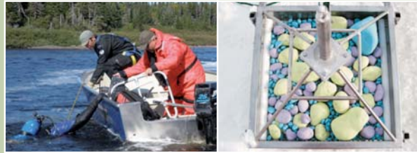
Plongée pour l'installation des quadrats de galets traceurs