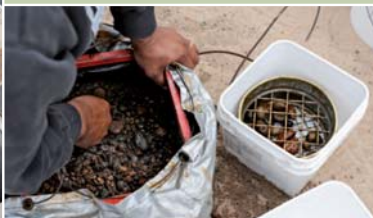
Tri du contenu d'un cube