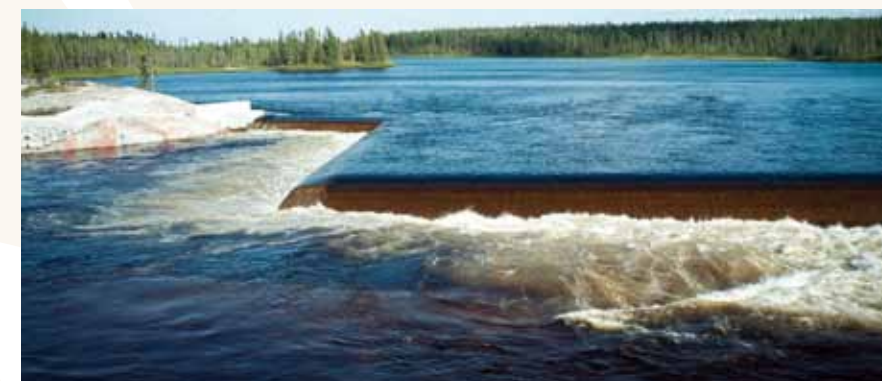
Seuil du PK 223 de la Rupert. En aval, Hydro-Québec a aménagé une frayère pour le doré, le meunier et le corégone.