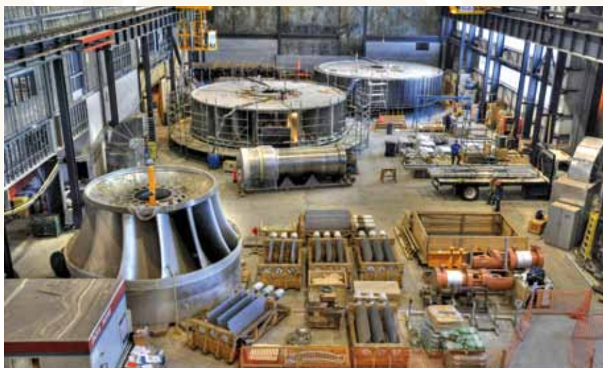
▲ Intérieur de la centrale de l'Eastmain-1-A, en construction.

Emplois créés et soutenus : 33 000 années-personnes