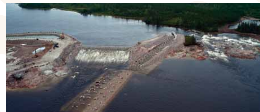
Seuil du PK 290 de la Rupert et chenal permettant aux poissons de circuler librement.