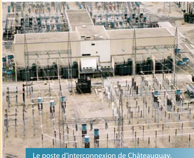
Le poste d'interconnexion de Châteauguay, semblable à celui en construction

Ce type de poste existe déjà à Hydro-Québec, mais il s'agit du premier à relier notre réseau à celui de l'Ontario. De ce fait, ce projet constitue un intérêt sur le plan technologique pour la région de l'Outaouais.