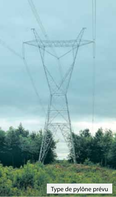
Type de pylône prévu