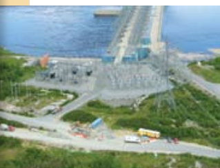
Poste La Grande-1