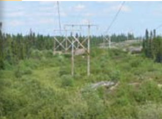
Ligne La Grande-1-Wemindji