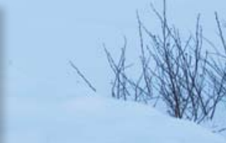
Poste actuel de Wemindji