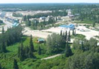
Communauté crie de Wemindji