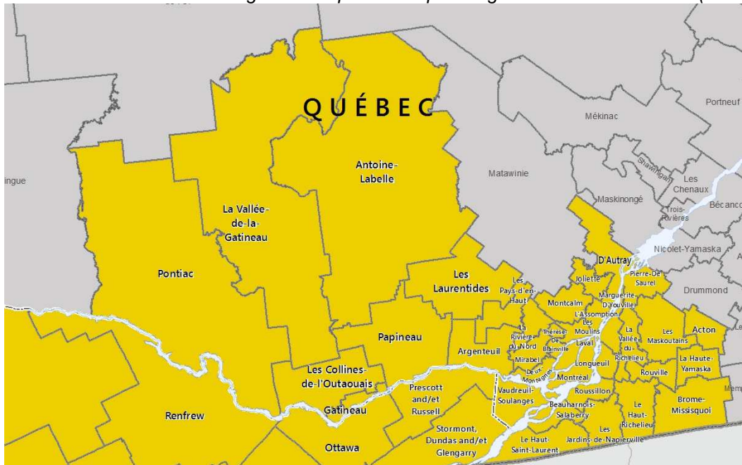
Extrait de la carte des lieux réglementés par l'ACIA pour l'agrile du frêne au Canada (2016)

Afin de ralentir sa propagation, des mesures doivent être prises lors des travaux sur la végétation. Ces mesures visent à éviter que le bois et les bois résiduels soient accessibles à la population qui risque de les déplacer en dehors de la zone réglementée.