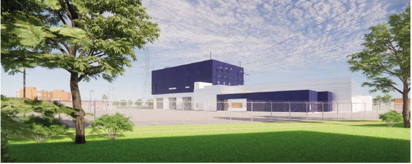
Simulation du futur poste de Côte-Saint-Luc