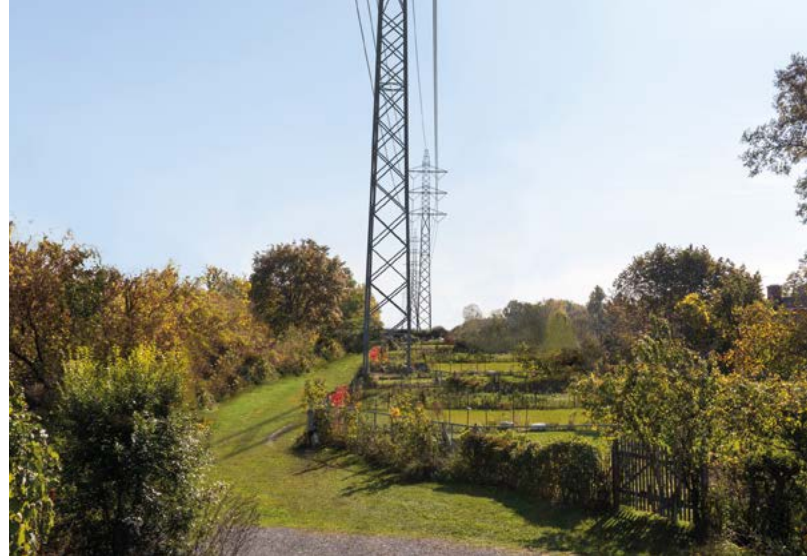
Simulation visuelle de la ligne électrique actuelle (à gauche) et projetée (à droite), à Montréal-Ouest