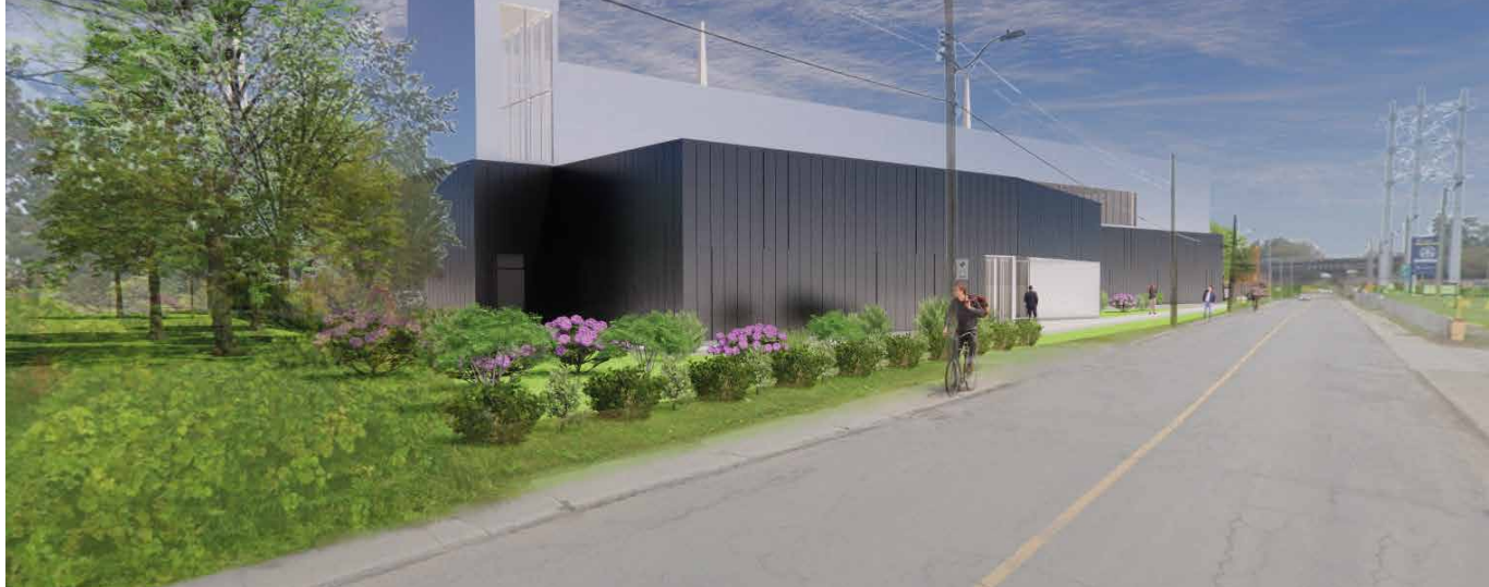
Simulation du futur poste Rockfield