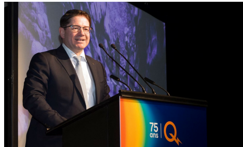
Éric Martel, président-directeur général, lors du lancement des célébrations entourant le 75 e anniversaire d'Hydro-Québec.

Je salue l'engagement du maire de New York, qui a récemment exprimé sa volonté d'ouvrir de nouvelles discussions avec nous en vue de concrétiser le projet d'interconnexion Champlain Hudson Power Express (CHPE). Ce projet vise la construction d'une ligne souterraine et sous-fluviale à courant continu entre la frontière canado-américaine et la