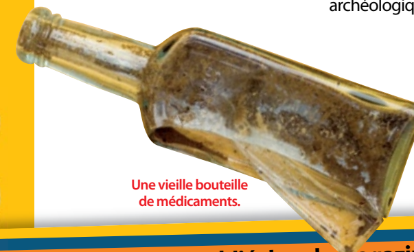
Une vieille bouteille de médicaments.