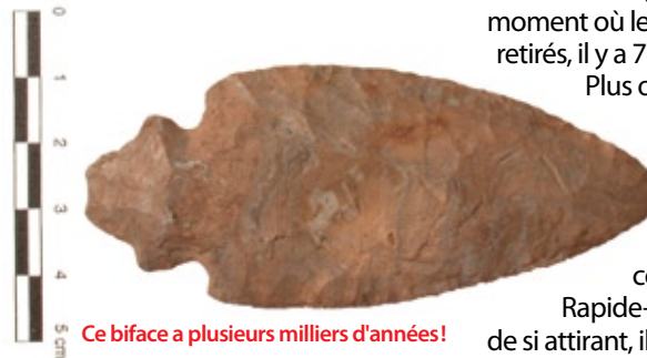
Ce biface a plusieurs milliers d'années!

Un biface, une arme de chasse. Ce biface a plusieurs milliers d'années! Fait étrange, ce genre d'arme était plutôt fabriqué par des Amérindiens du sud des Grands-Lacs. Comment s'est-il retrouvé en Mauricie? Y a-t-il eu du commerce entre les deux peuples? C'est très intrigant.