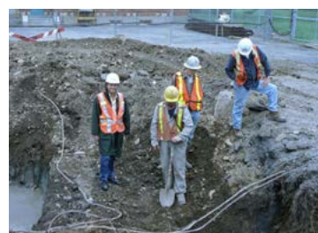
Remblayage et réfection de surfaces