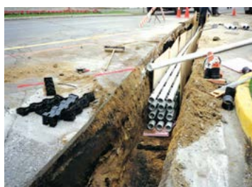
Installation des conduits