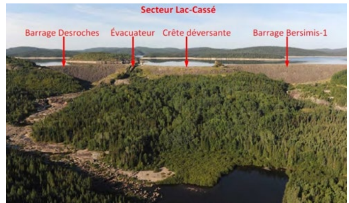
Crête déversante de Bersimis-1

Attention : la signalisation peut changer quotidiennement, soyez vigilants.