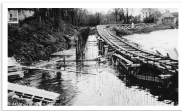
Construction du mur de soutènement Simon-Sicard, 1929

Par ailleurs, dans le cadre d'études sur le milieu humain, au hasard de vos déplacements piétonniers dans le quartier, il se peut que vous croisiez, notamment dans le secteur du parc Louis-Hébert, des représentants d'une firme de consultants œuvrant pour le compte d'Hydro-Québec. Ceux-ci seront bien identifiés et souhaiteront documenter l'utilisation du site par les résidents. Vous serez libres de répondre ou non à leurs questions.