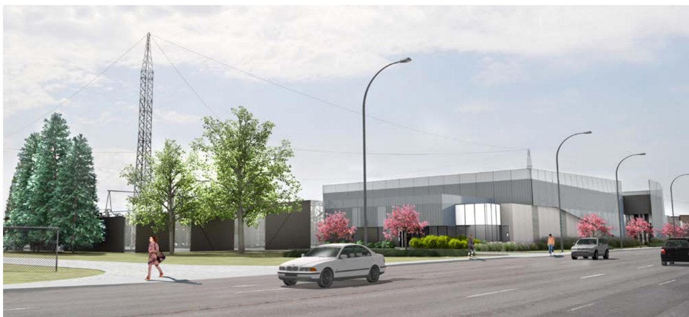
Simulation visuelle du poste projeté

Le poste Hochelaga sera alimenté par deux lignes souterraines à 315 kV d'environ 5 km chacune, à partir du poste de Notre-Dame, situé à l'angle des rues Notre-Dame Est et des Futailles. En raison des nombreuses contraintes techniques et environnementales sur plusieurs des principaux axes est-ouest, un seul tracé par ligne a été élaboré (voir la carte). À partir du poste Notre-Dame, l'une des lignes emprunte l'avenue Haig et l'autre, la rue Beauclerk avant de bifurquer dans la rue de Marseille vers le sud-ouest. Les deux lignes suivent ensuite le boulevard de l'Assomption vers le sud-est, puis la rue Hochelaga jusqu'au nouveau poste.