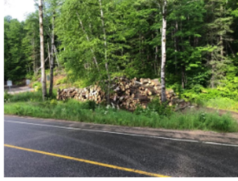
Bois coupé d'une longueur de 4 pieds empilé au km 47 de la route menant à l'aménagement de Rapide-Blanc à proximité du sentier de motoneige

Dans le cadre des travaux de sécurisation de la paroi rocheuse longeant le chemin d'accès à l'aménagement de Rapide-Blanc, nous avons réalisé des travaux de déboisement. Afin de donner une deuxième vie au bois coupé, nous l'avons empilé à proximité de la route et le mettons à votre disposition. Nous vous invitons à le récupérer durant les vacances de la construction de manière sécuritaire. Premier arrivé, premier servi, pas de réservation !