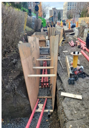
Reconstruction du réseau électrique souterrain.