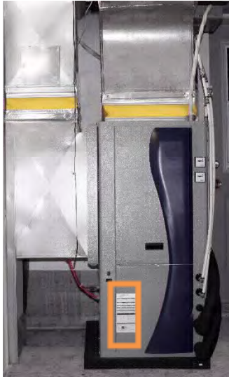
Illustration de l'emplacement de l'étiquette sur l'appareil intérieur d'une thermopompe air-air bibloc (centrale).