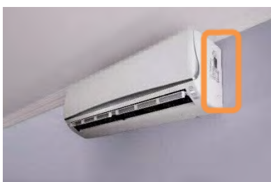
Illustration de l'emplacement de l'étiquette sur l'appareil intérieur d'une thermopompe air-air minibloc sans conduit (murale).