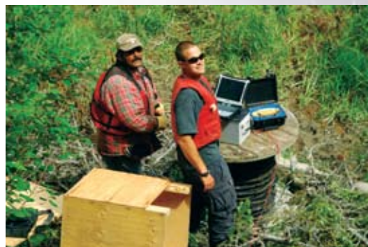
Installation du matériel électronique pour le comptage des saumons