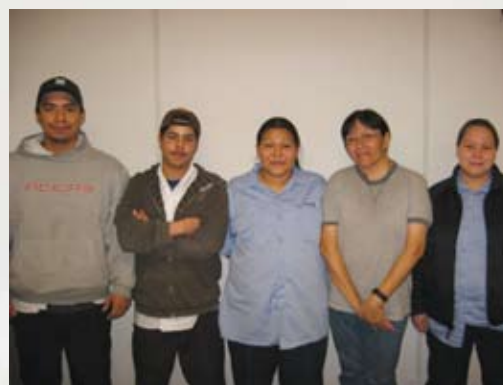
Employés innus des communautés d'Ekuanitshit et de Pakua Shipi travaillant à la conciergerie, à l'entretien et à la préparation des repas.

En dehors des périodes de travail, des activités de loisirs variées sont offertes par les animateurs, telles que le bingo, le volleyball, la marche ou le billard.