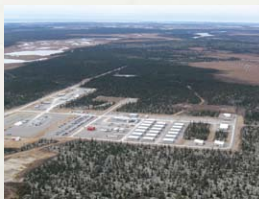
Campement du kilomètre 1