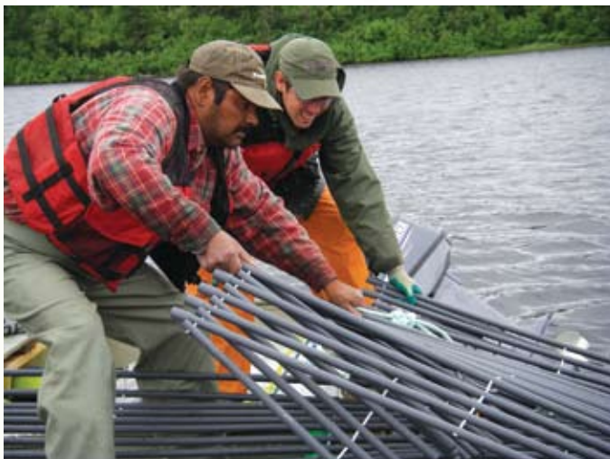
Mise en place de la barrière de comptage de saumons atlantiques

En décembre 2009, plus de 600 personnes travaillaient sur le chantier de la Romaine. Ce nombre va augmenter au cours des prochaines années, pour dépasser les 2 300 en 2014. La majorité des femmes et des hommes qui participeront au chantier seront embauchés directement par différentes entreprises chargées de réaliser les travaux.