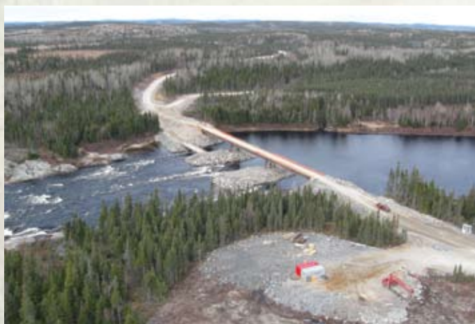
Pont temporaire à la hauteur de la Romaine-1

La construction de la route de la Romaine suit son cours. La route est maintenant carrossable sur 48 kilomètres et l'entrepreneur poursuit les travaux sur la structure de la chaussée. Pour des raisons de sécurité, son utilisation est restreinte aux travailleurs du projet de la Romaine.