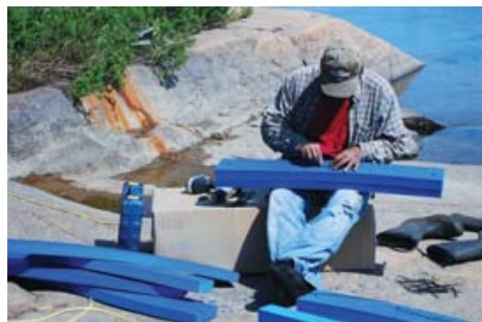
Assemblage des bouées pour la barrière de comptage

Ainsi, moins de 15 % des travailleurs seront des employés d'Hydro-Québec. Toutefois, à titre de maître d'œuvre, Hydro-Québec demeure responsable de la surveillance de la qualité des travaux et de la sécurité des travailleurs au chantier.